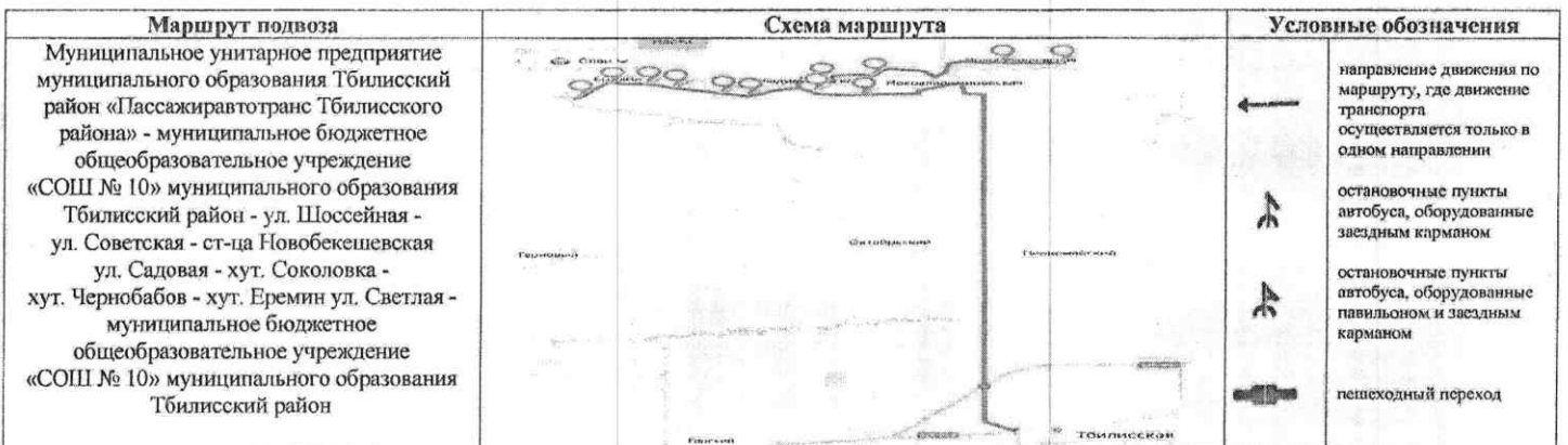
СХЕМА маршрута движения автотранспорта муниципального бюджетного общеобразовательного учреждения «СОШ № 10» муниципального образования Тбилисский район (ПАЗ – 32053-70, г/н О 712 РТ 123, ПАЗ – 32053-70, г/н М 545 УЕ 123)

Начальник управления образованием муниципального образования Тбилисский район