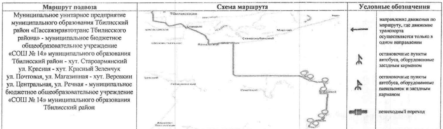
СХЕМА маршрута движения автотранспорта муниципального бюджетного общеобразовательного учреждения «СОШ № 14» муниципального образования Тбилисский район (ПАЗ – 3234-70, г/н Р 224 ТК 123, ПАЗ – 32053-70, г/н Т 951 УЕ 123)

Начальник управления образованием муниципального образования Тбилисский район