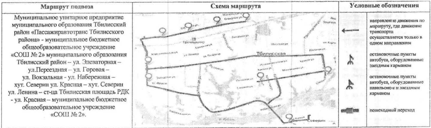
СХЕМА маршрута движения автотранспорта муниципального бюджетного общеобразовательного учреждения «СОШ № 2» муниципального образования Тбилисский район (ГАЗ – 66R33, г/н А 716АВ 193, ГАЗ – 66R33, г/н А 789АВ 193)

Начальник управления образованием муниципального образования Тбилисский район