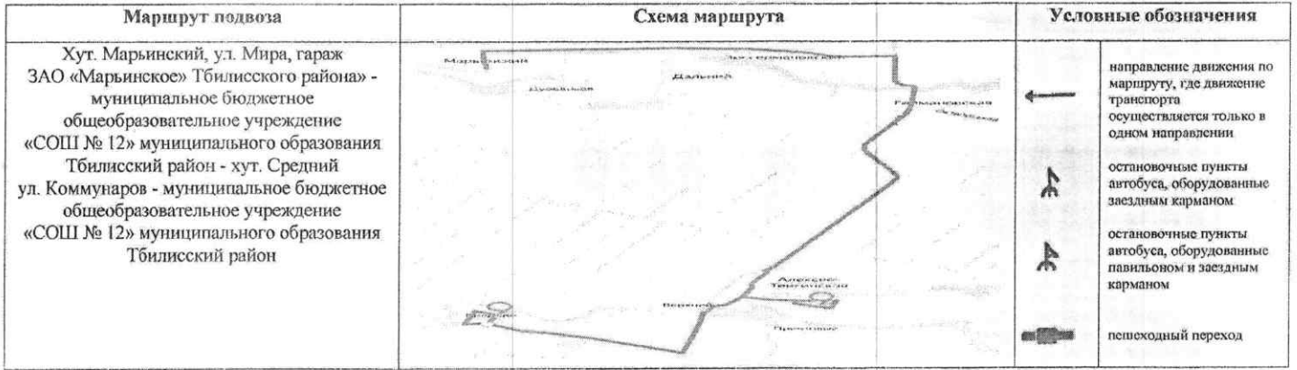
СХЕМА маршрута движения автотранспорта муниципального бюджетного общеобразовательного учреждения «СОШ № 12» муниципального образования Тбилисский район (FIAT 240 GS1-L4 г/н С 670 OX 123)

Начальник управления образованием муниципального образования Тбилисский район