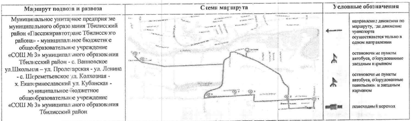
СХЕМА маршрута движения автотранспорта муниципального бюджетного общеобразовательного учреждения «СОШ № 3» муниципального образования Тбилисский район (ГАЗ – 32(53-70, г/н П 691 СУ 123)

Начальник управления образованием муниципального образования Тбилисский район