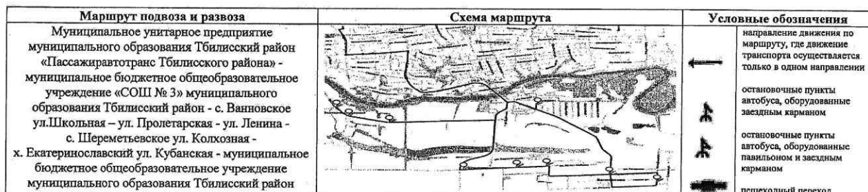
СХЕМА маршрута движения автотранспорта муниципального бюджетного общеобразовательного учреждения «СОШ № 3» муниципального образования Тбилисский район (ПАЗ – 32053-70, г/н Н 691 СУ 123)

УТВЕРЖДЕНА постановлением администрации муниципального образования Тбилисский район от 30 июля 2021 г. № 790