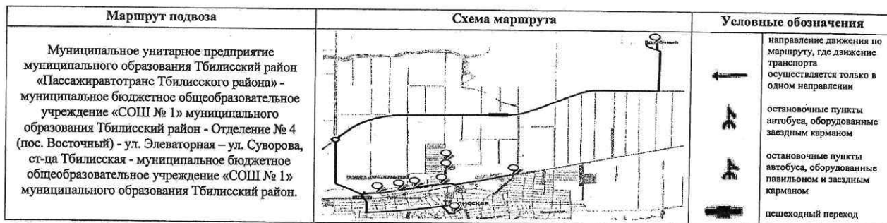
СХЕМА маршрута движения автотранспорта муниципального бюджетного общеобразовательного учреждения «СОШ № 1» муниципального образования Тбилисский район (ПАЗ – 42053-70, г/н А 349 ЕН 123, ПАЗ – 423470-04, г/н Т 893 ВН 193)

УТВЕРЖДЕНА постановлением администрации муниципального образования Тбилисский район от 30 июля 2021 г. № 790