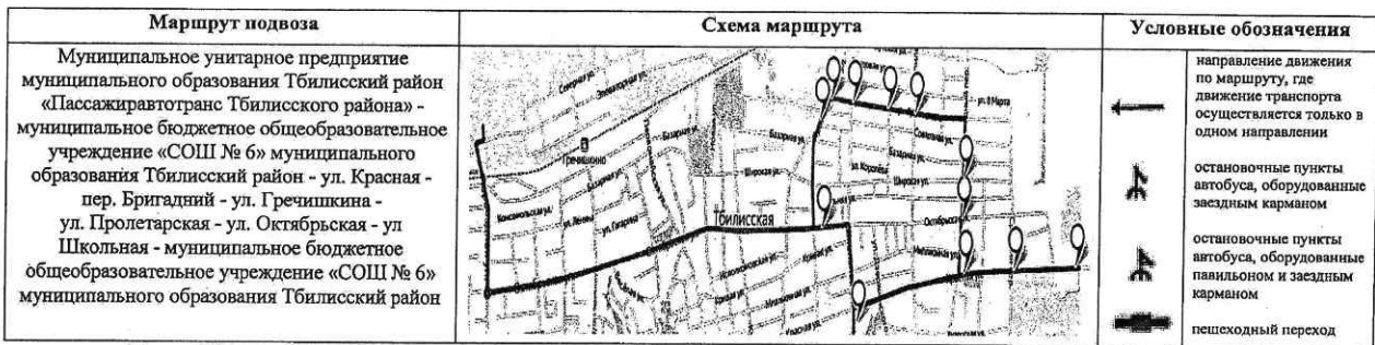
СХЕМА маршрута движения автотранспорта муниципального бюджетного общеобразовательного учреждения «СОШ № 6» муниципального образования Тбилисский район (ПАЗ – 32053-70, г/н Н 528 УС 123)

Начальник управления образованием муниципального образования Тбилисский район