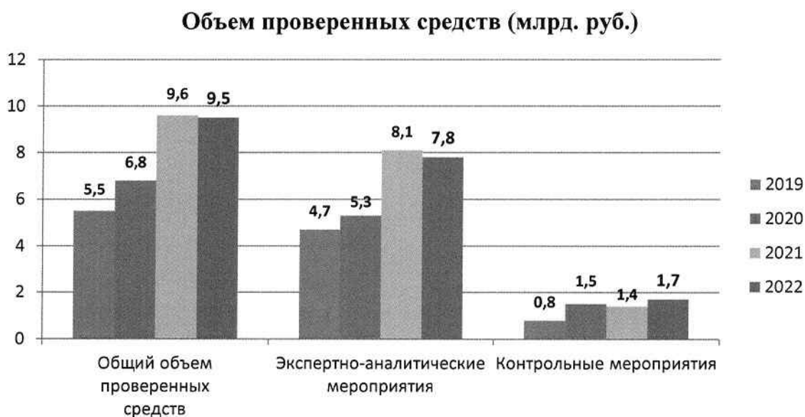
Диаграмма № 1

Общий объем проверенных средств составил 9,5 млрд. руб., в том числе: по контрольным мероприятиям – 1,7 млрд. руб.; по экспертно-аналитическим мероприятиям – 7,8 млрд. руб.