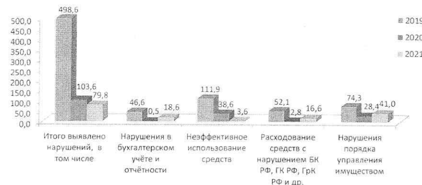
Диаграмма № 2

Общий объем выявленных нарушений за год, в соответствии с классификатором составил 79,8 млн. руб., в том числе: