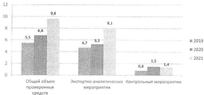
Объем проверенных средств (млрд. руб.)

Общий объем проверенных средств за 2021-2024 гг. составил 9,6 млрд. рублей, в том числе: