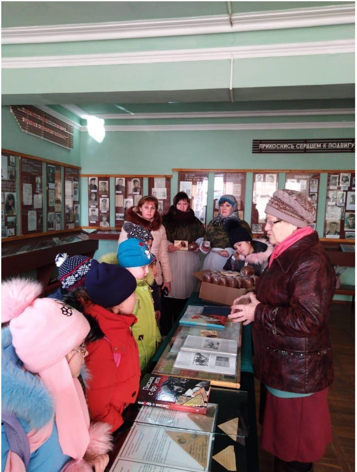
29 января участие в мероприятиях посвященных освобождению Тбилисского района от немецко-фашистских захватчиков.