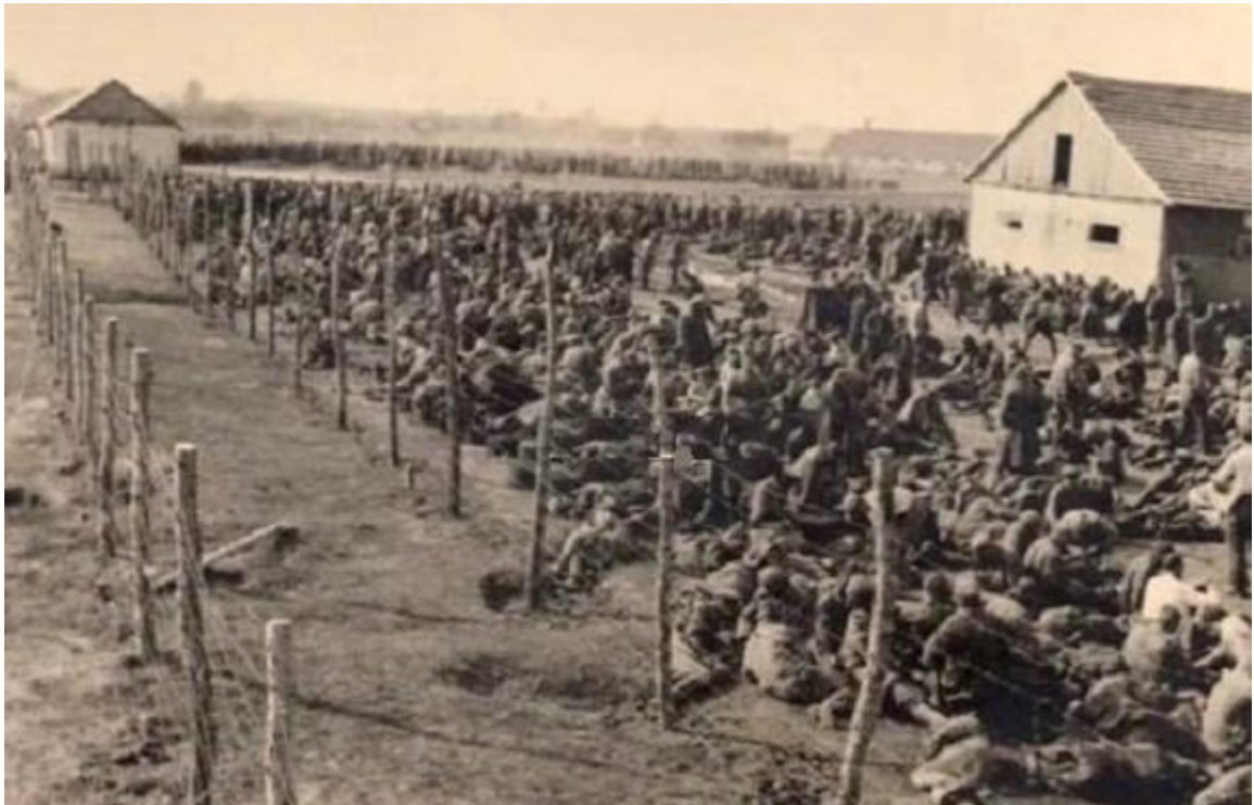
Осень 1941 года. Содержание советских военнопленных в румынском лагере на территории Молдавии