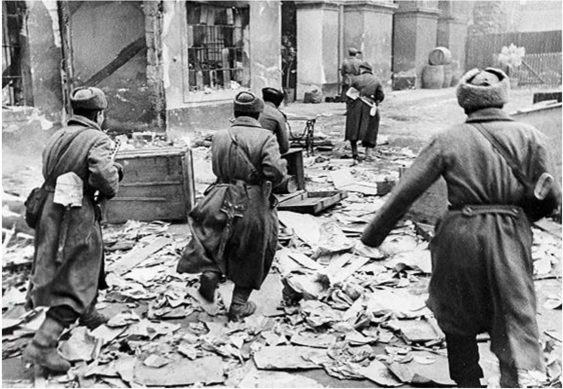
Январь 1945 года. Советские бойцы штурмуют Будапешт.