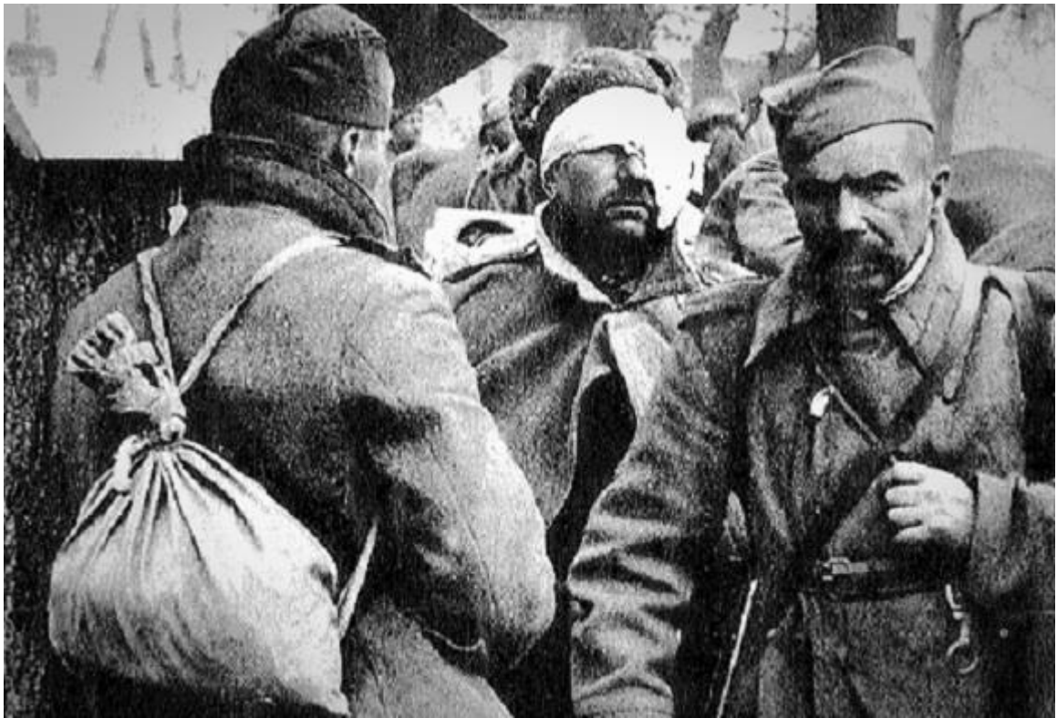
Январь 1945 год. Будапешт. Раненые советские солдаты.