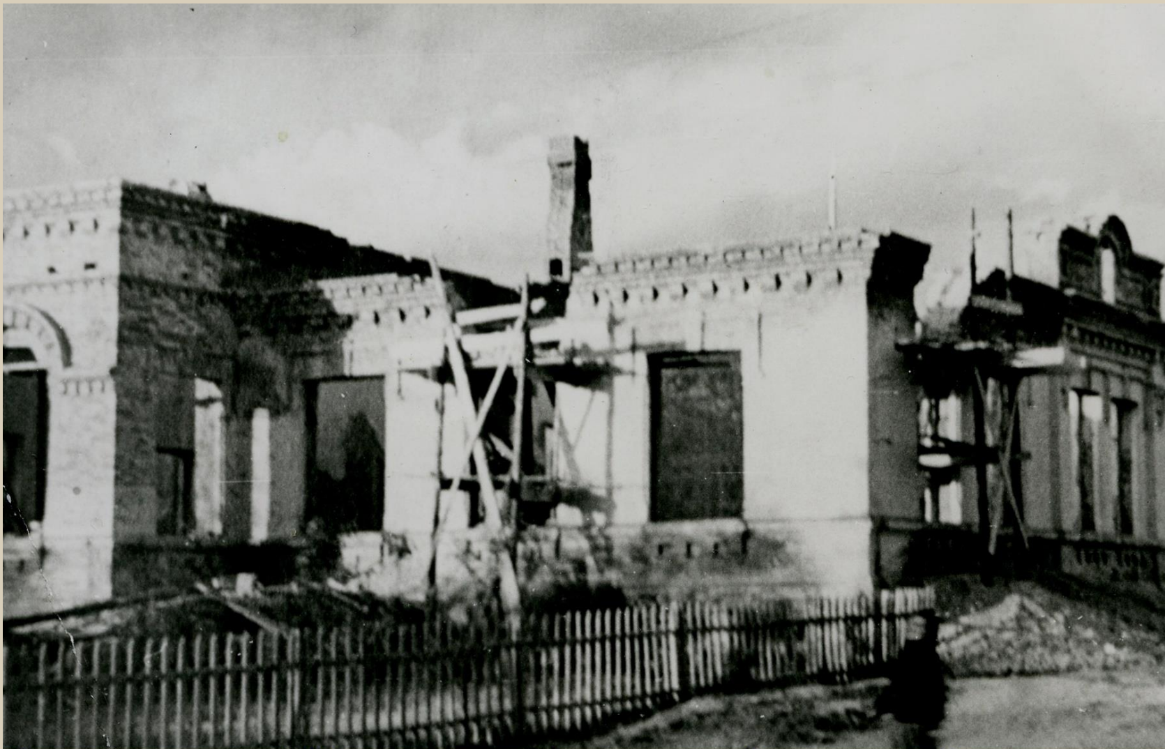
Здание с.ш.№1 после оккупации.В годы войны здесь размещался госпиталь.