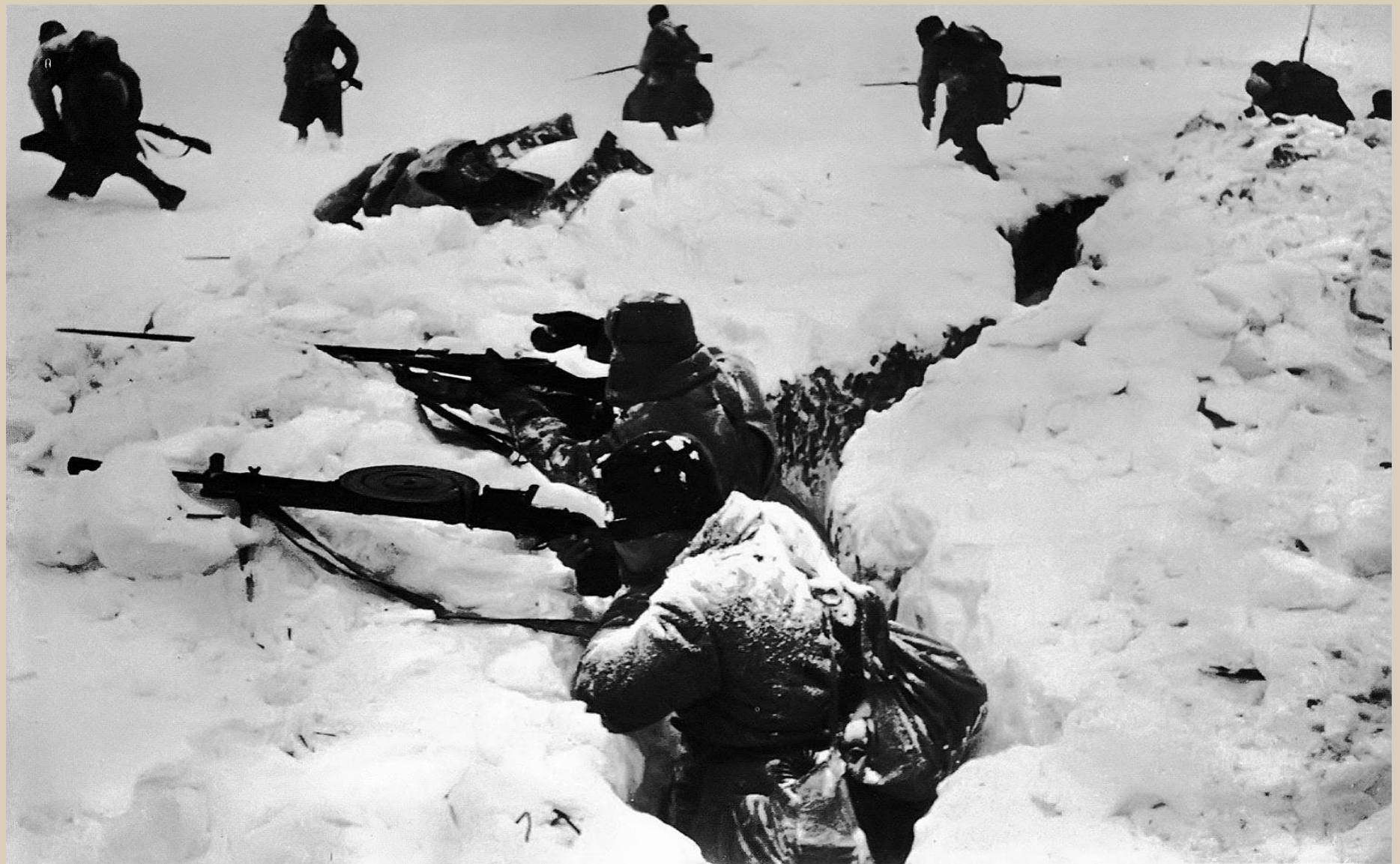
Идет бой.