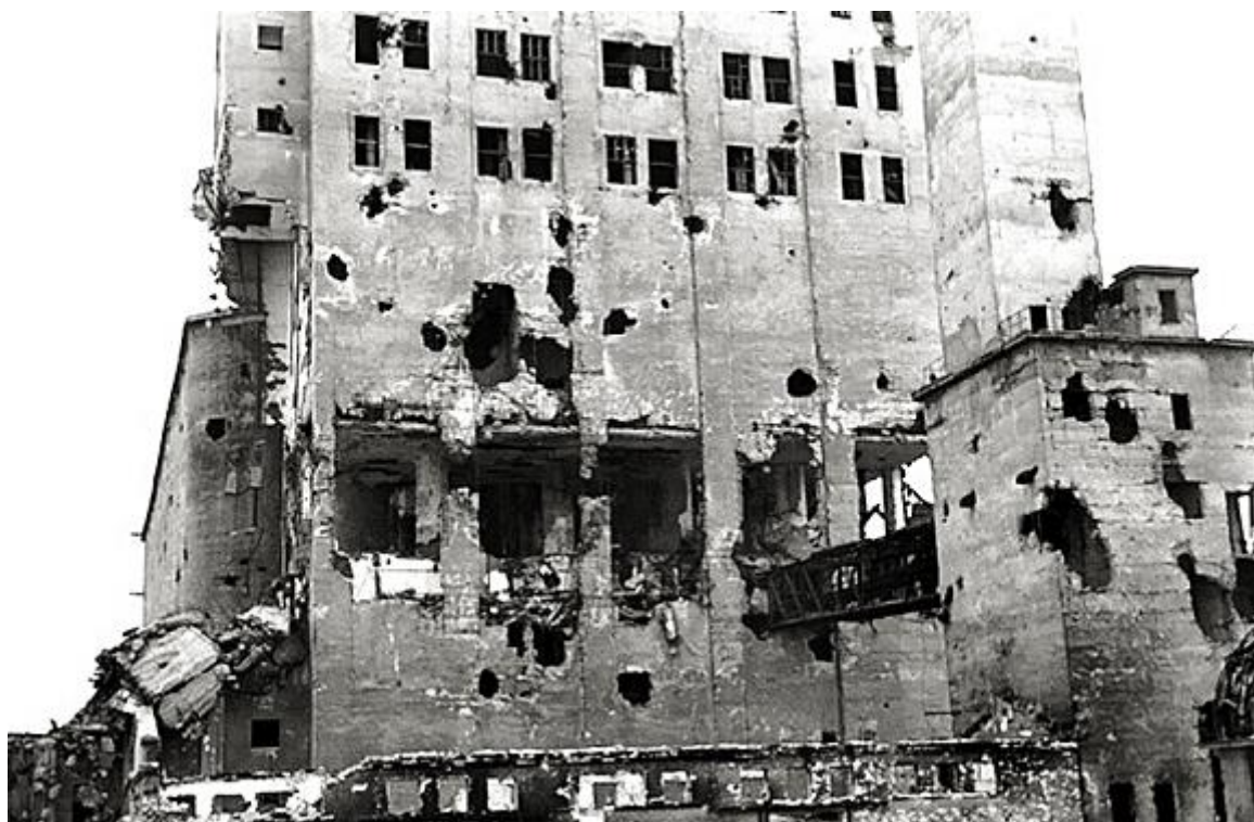
Сентябрь 1942 года. Здание элеватора после фашистского обстрела