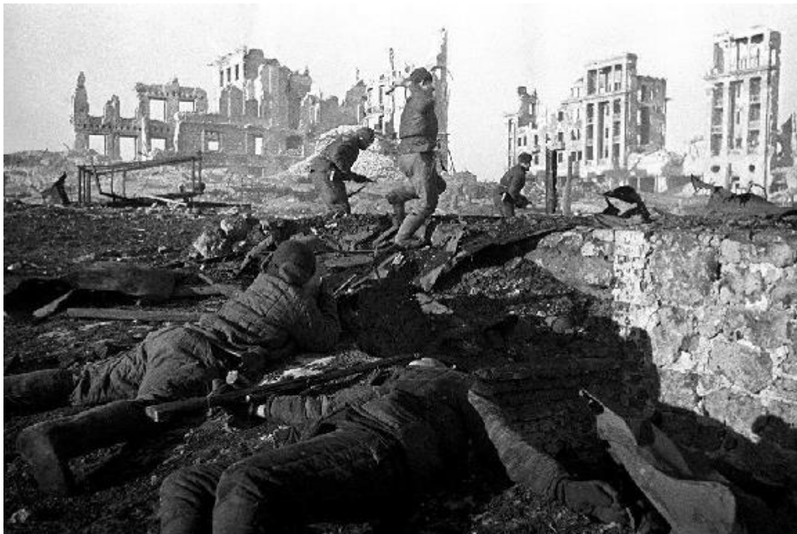
Сентябрь 1942 года. Бойцы 92-й ОСБр ведут бой на улицах Сталинграда