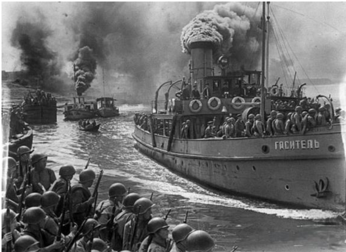
Переправа наших войск на правый берег Волги в Сталинград. Сентябрь 1942 года.